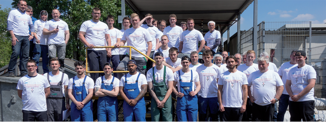
Bezirkswettbewerb beim BV Köln 2019

Im Wettbewerb „Jugend schweißst“ bekommen auch im Jahr 2023 junge Schweißerinnen und Schweißer wieder die Möglichkeit, ihr Können in einem größeren Rahmen zu zeigen.